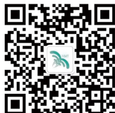
港澳台文化交流促进协会

备注：【具体招生信息请以正式招生简章为准，以上香港中学文凭考试招生信息仅供参考】