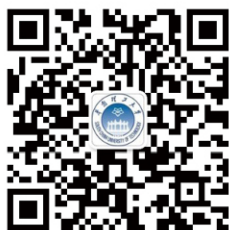
华南理工大学招生办

中国教育交流（香港）中心网站（ http://www.umainland.hk ）、高等教育展网站（ www.studymainland.hk ）、内地（祖国大陆）高校面向港澳台招生信息网（ http://www.gatzs.com.cn ）、香港中学文凭考试学生网上报名系统（ http://eea.gd.gov.cn ）。